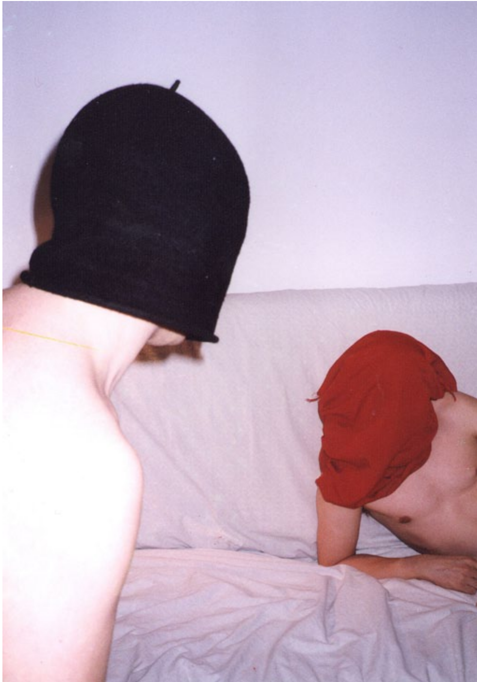
« Les affranchis », Silver photography, digital RA-4 color satin prestige, 100 x 80 cm, 1995.