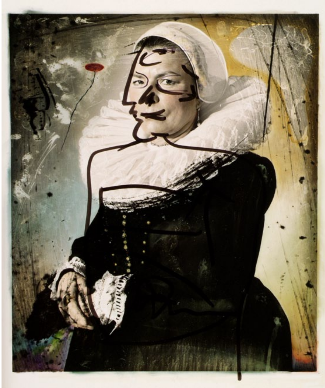
“Eternity Past, Berlin”, Photographie, Tirage argentique sur aluminium, 43,5 x 36,5 cm, 1998.