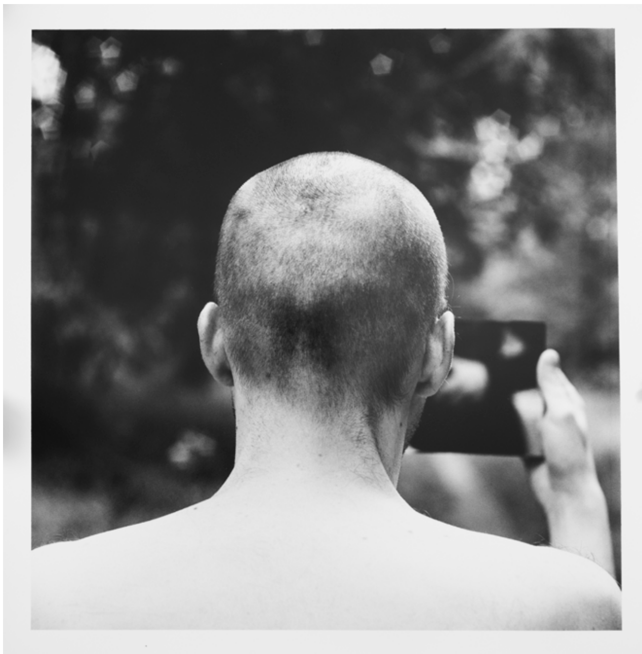
« Entêtement », tirage noir et blanc sur papier baryté, 70 x 70cm, 2017.