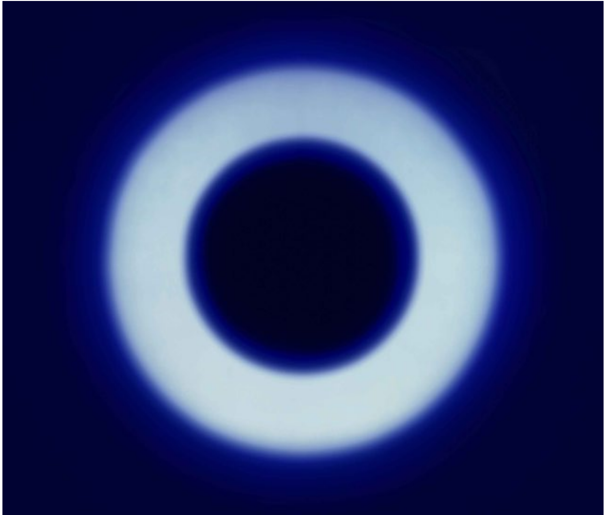
« Gaze (i) », lambda c print, bliss edition, 52x61 cm, 2009.