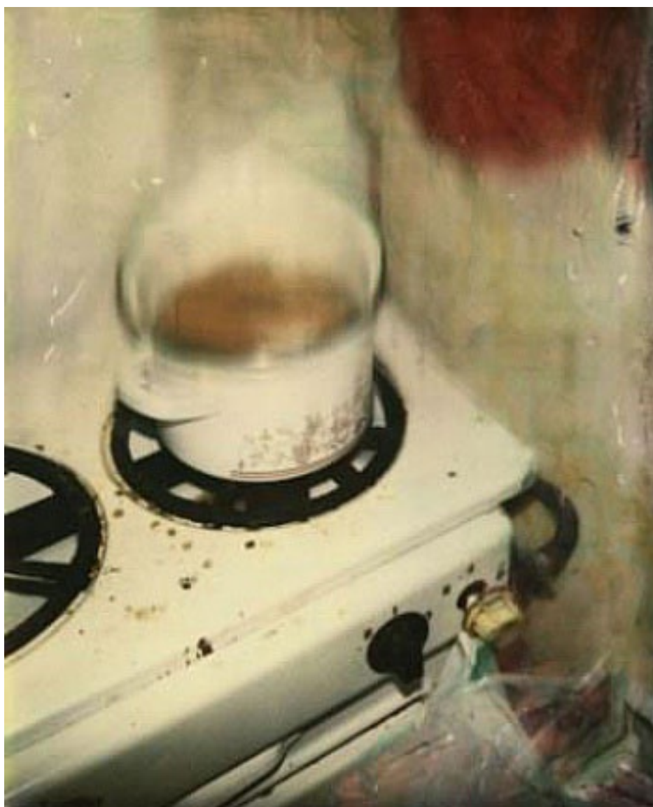
"1991, Budapest, cuisine R.H.", tirage jet d'encre pigmentaire sur papier d'Hahnemühle d'après Polaroid, 40 x 50cm, 1991.