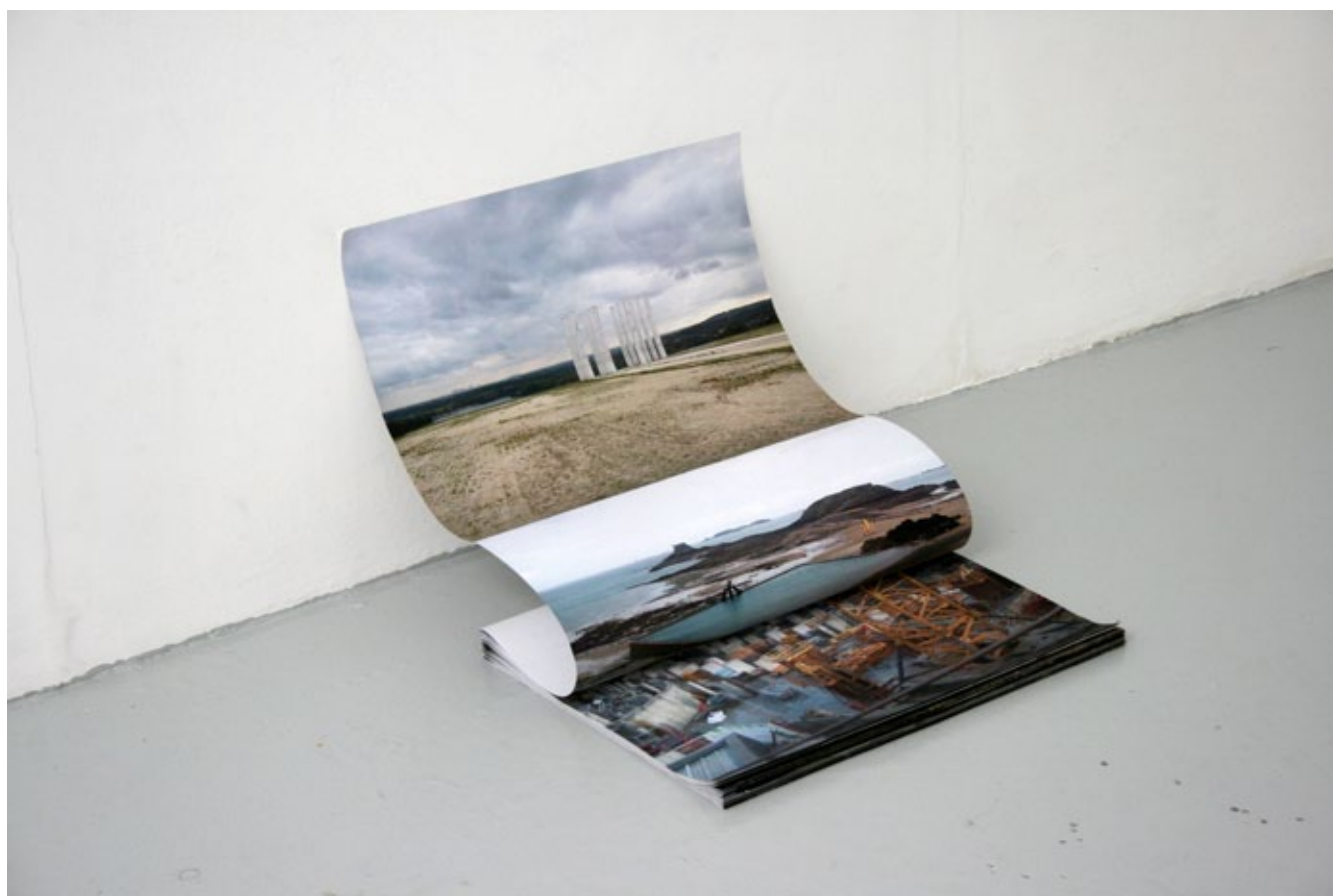
“Leporello”, impression couleur sur papier, 42 × 600 cm déplié, 2013.