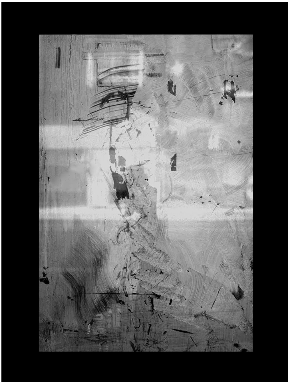
“City Twombly- 1”, Photographie, épreuve au chlorobromure d’argent, 100x75cm, 2011.