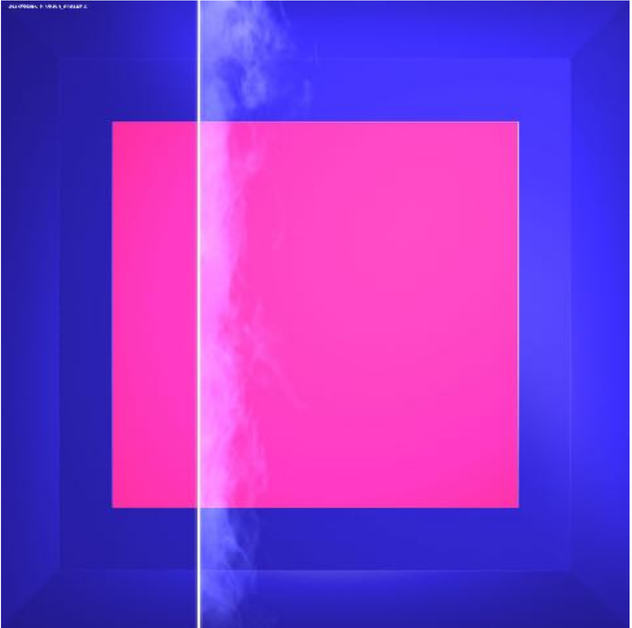
Light Painting, Magenta and Blue, One Stripe, 2021. Impression numérique 100 x 100 cm.