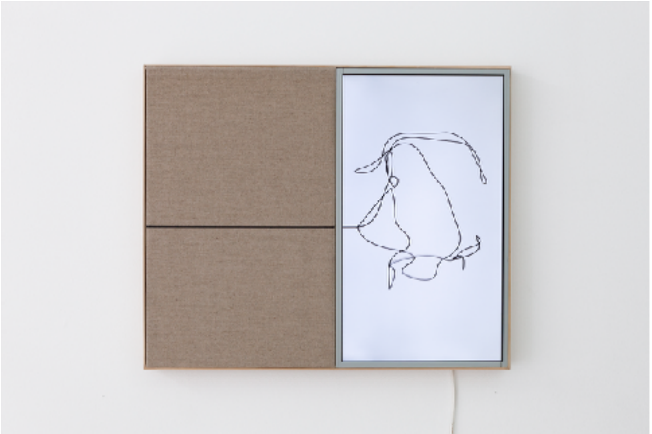
Lignes, plans et contrepoints 04, 2016. Technique mixte, huile sur toile et boucle numérique sur écran, 67 x 53 cm.