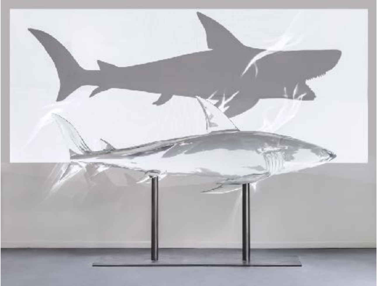
Shark , 2008. Époxy, 165 x 260 x 120 cm. Collection particulière, Paris.