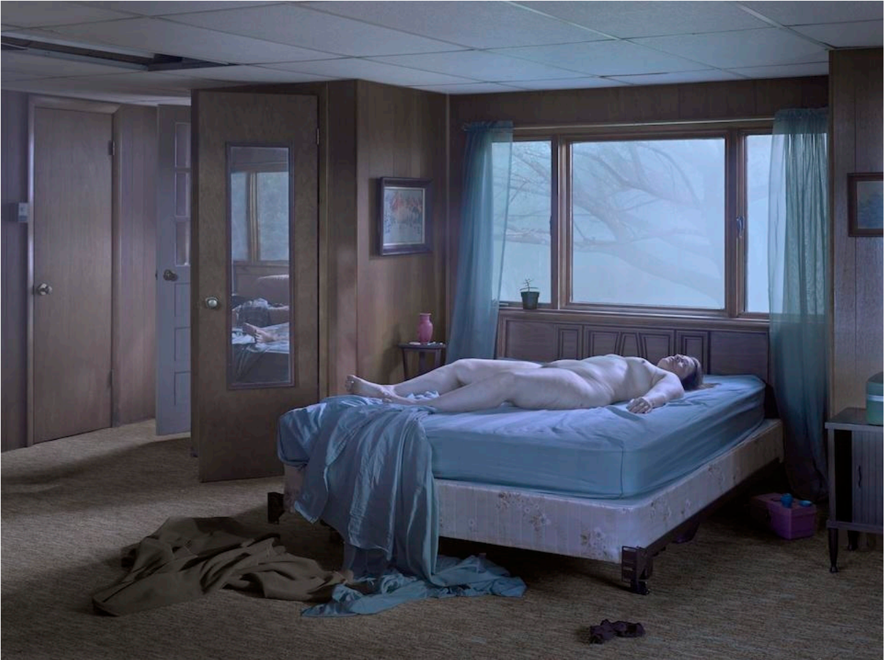
Reclining Woman on Bed , 2013 Photographie couleur numérique, 95,3 × 127 cm

Né en 1962 à Brooklyn, États-Unis Vit et travaille à New York City, États-Unis