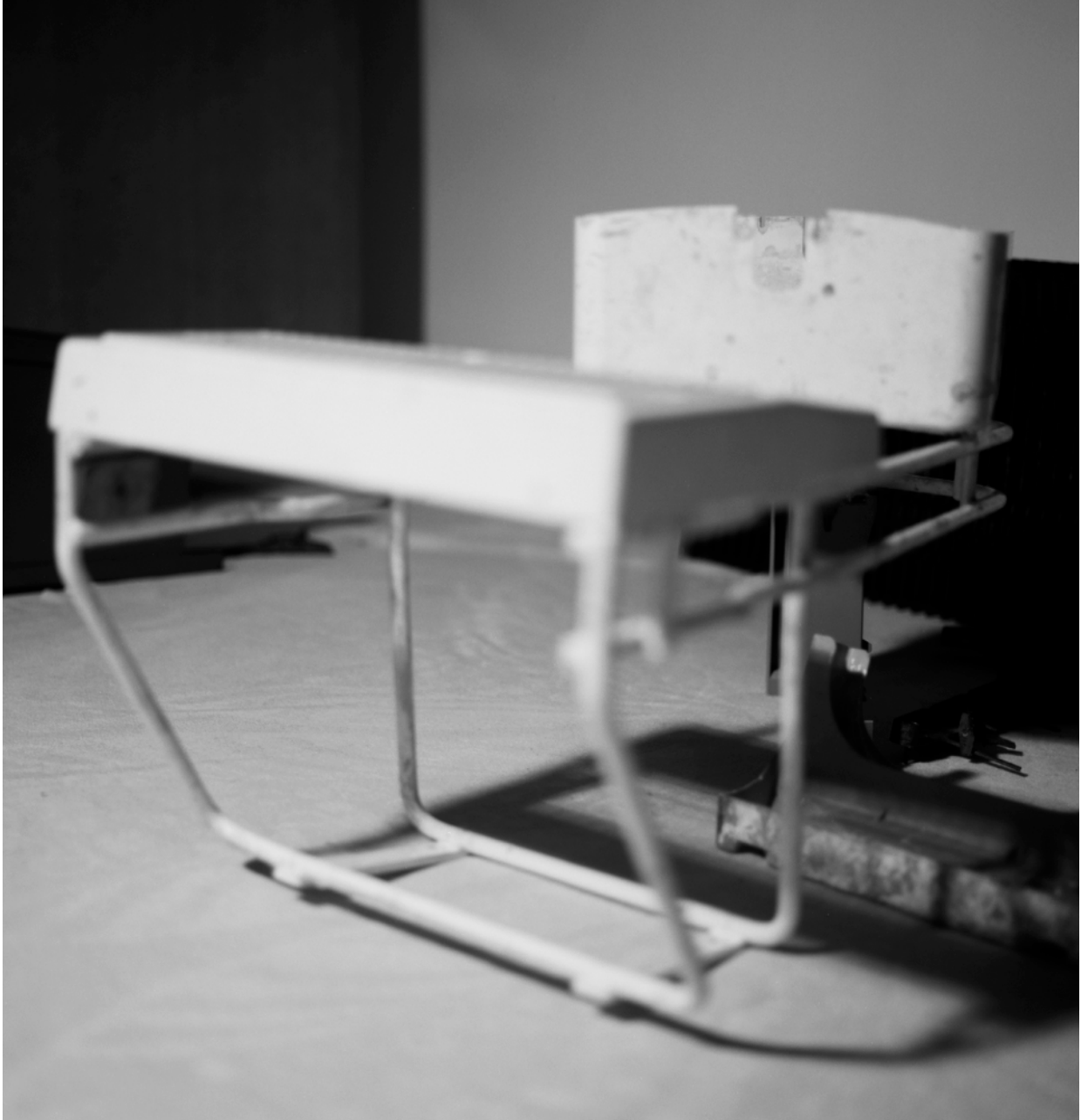
Sans titre , Série Transats , 2002 Photographie noir et blanc, 24 x 24 cm

Né en 1960 à Cully, Vit et travaille à Bruxelles