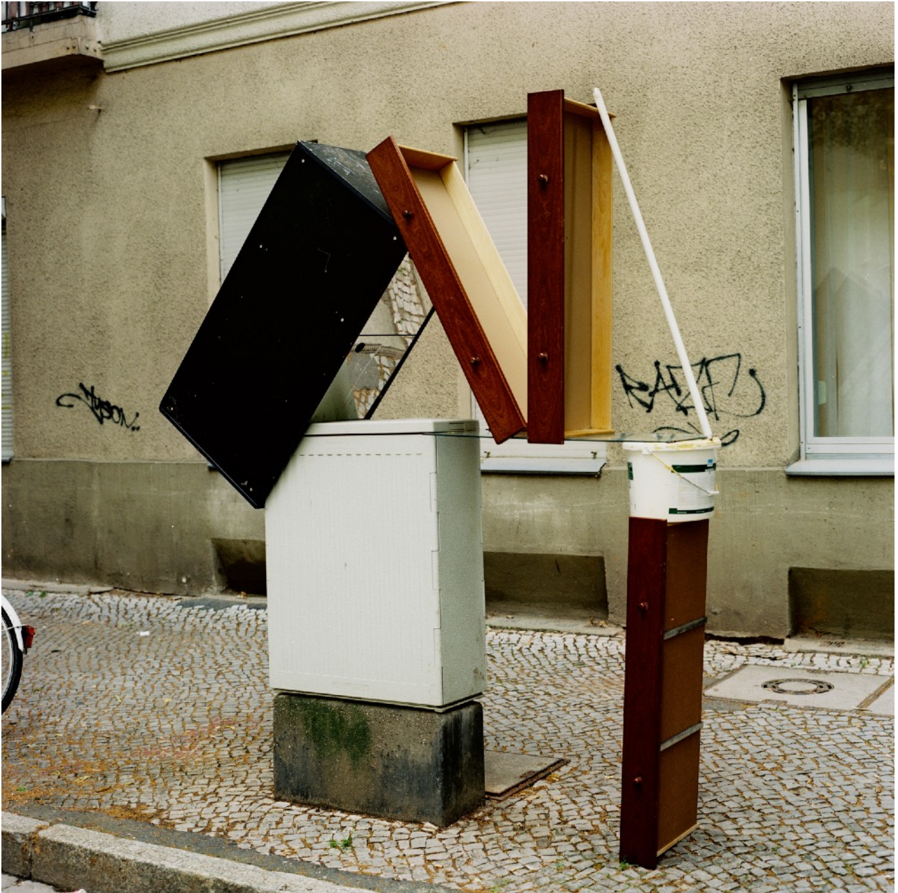
Berlin, Lichtenrader Strasse 12, 2009 Tirage argentique sur Alu/dibond, 25 x 25 cm

Né en 1982 au Mans Vit et travaille à Paris