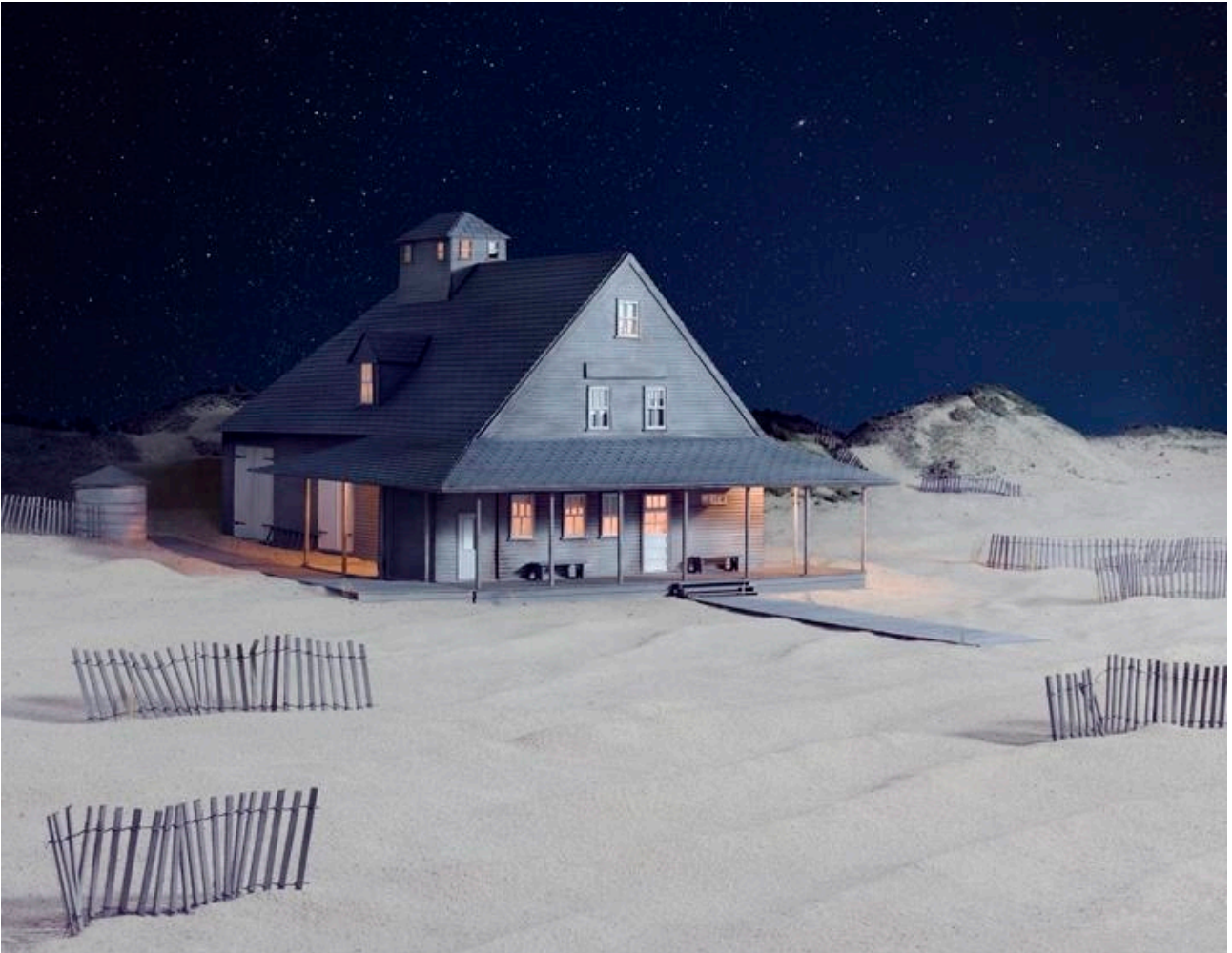
Party at Caffey's Inlet Lifesaving Station (Dare County, NC), 2013 Photographie couleur, 125,4 x 159,2 cm

Né en 1953 à Lansing, Michigan, États-Unis Vit et travaille à New York, États-Unis