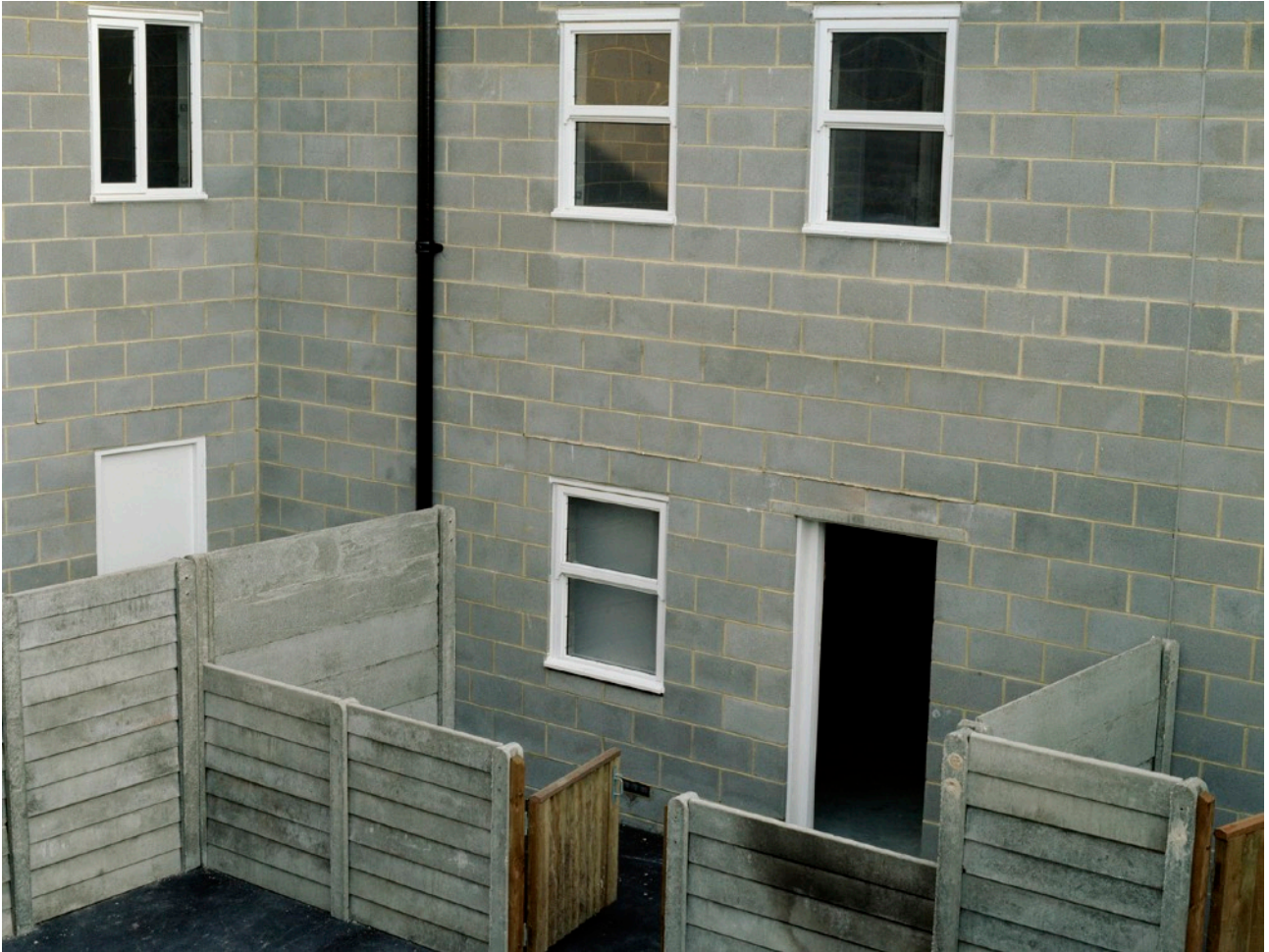
Public Order , Lola Court, 2003 Photographie, 94,3 x 76 cm Courtesy de l'artiste et de l'Adagp.

Née en 1972 à Durham, Royaume-Uni Vit et travaille à Londres, Royaume-Uni