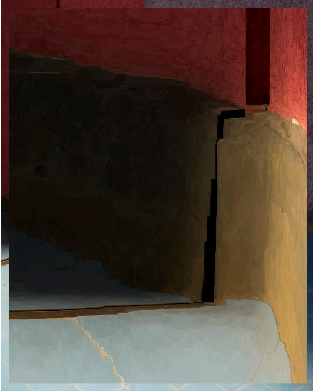
Transformation 80 (coin rouge) , 2015, de la série Transform : Power, 2016 Tirage pigmentaire sur papier Ilford, 63 x 50 cm.

Né en 1976 à Gap, France Vit et travaille à Lausanne, Suisse