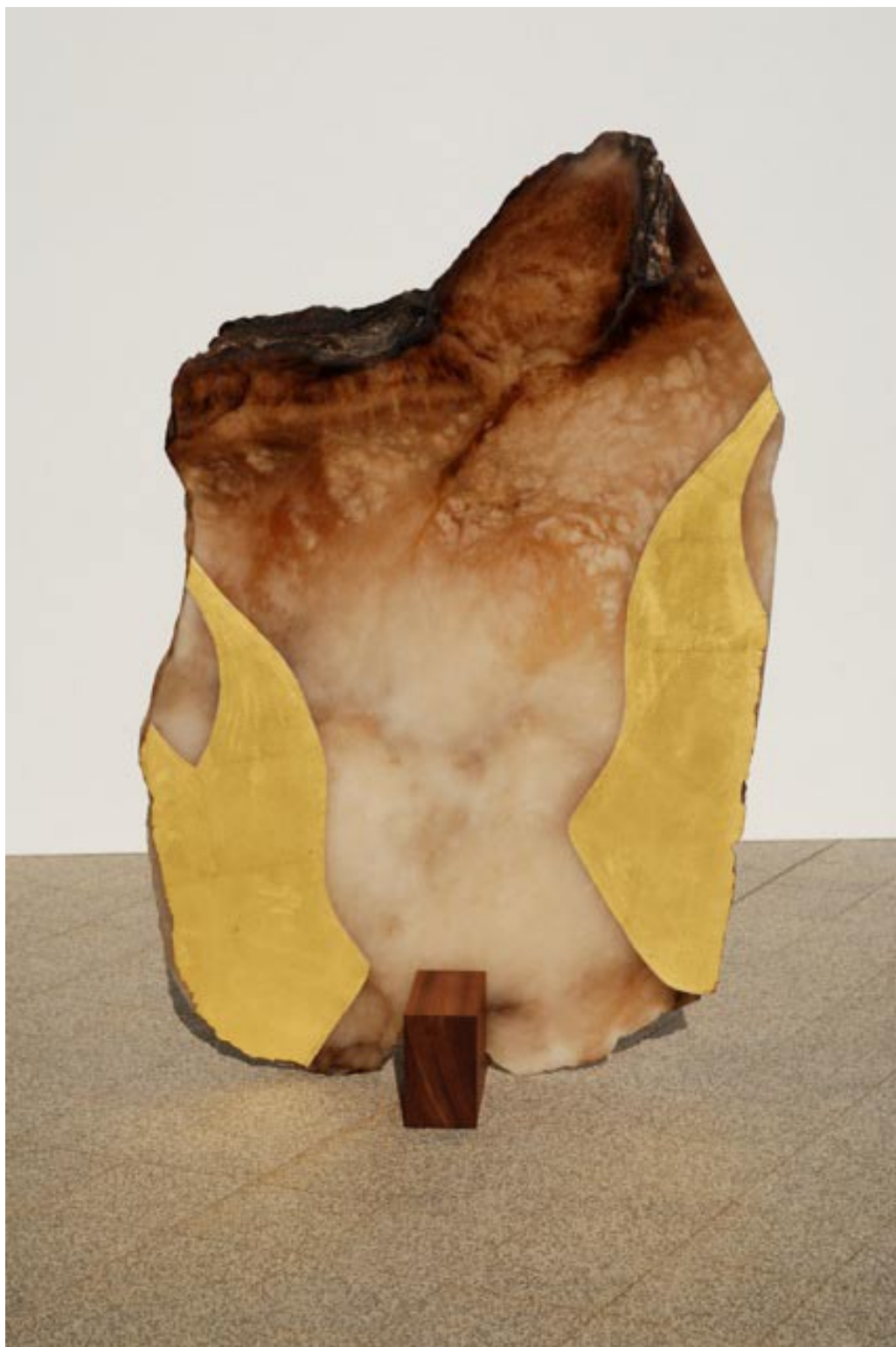
Torse , albâtre et feuilles d'or, Hauteur 60 cm, 2010.