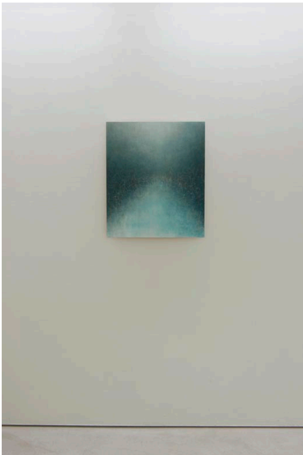
WAVE#83 , peinture sur papier, 53 x 45 cm, 2010.