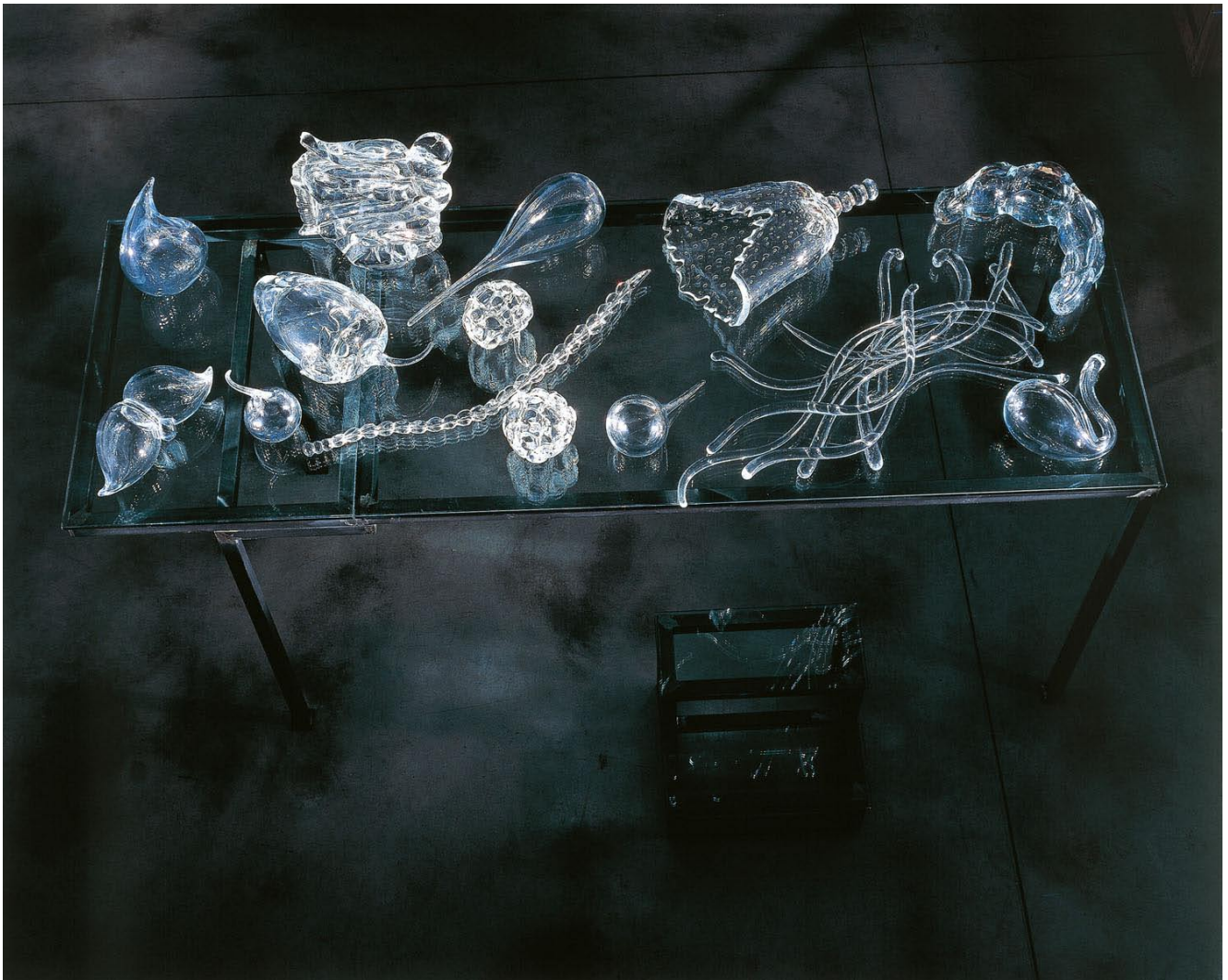
Crystal Landscape of Inner Body (Buffle) , cristal, métal, verre, 95 x 70 x 190 cm, Collection privé, 2000.