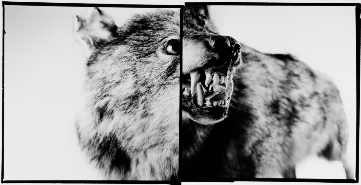
Le Loup , photographie argentique, 80 x 120 cm, 2010.