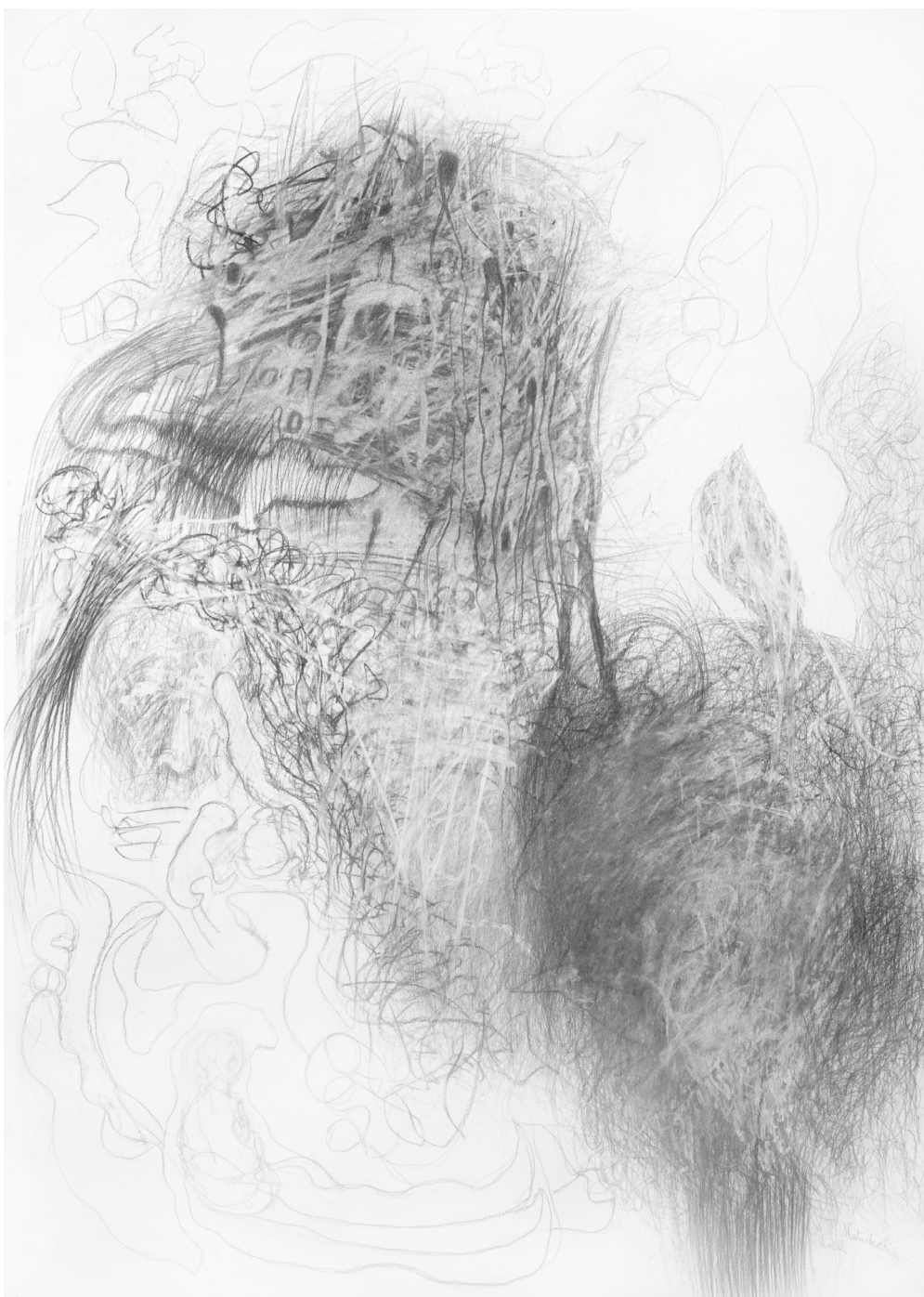
Sans Titre , mine de plomb, 170 x 75 cm, 2010.