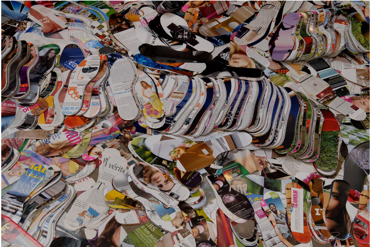
Semelles découpées dans magazines de l'oeuvre Projection , 2010.