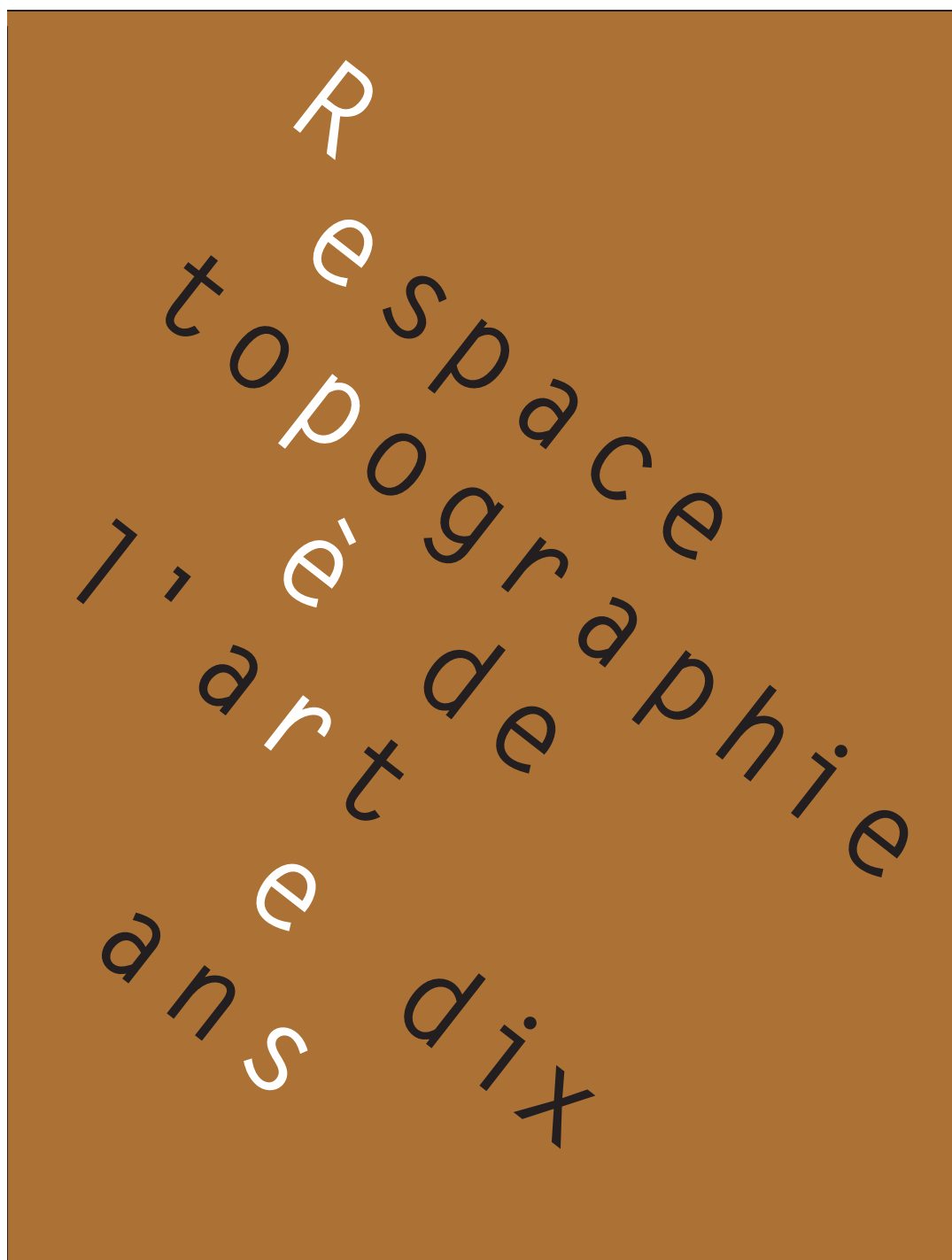
Couverture du catalogue de l'exposition, 2011.