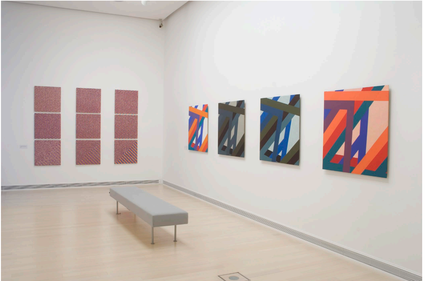
8 standard colours , acrylique sur toile, 62 x 62 cm, 1993.