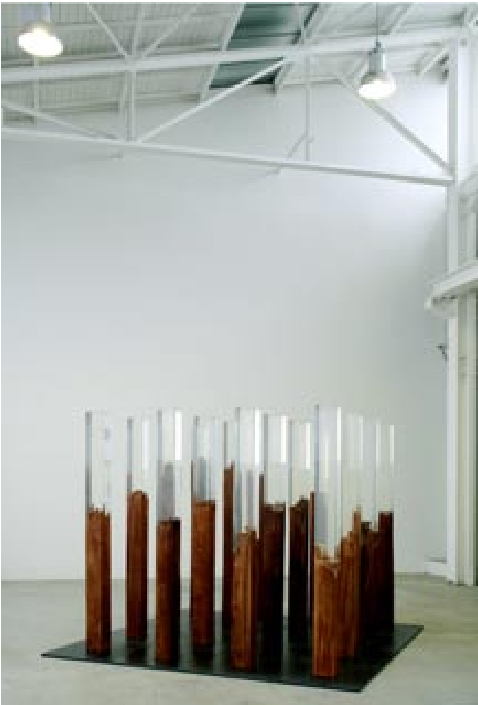
Wald der Ergänzungen , bois d'orme et plexiglas, 16 ergänzungen, 236 x 16,5 x 16,5 cm chacun, 2005-2009.