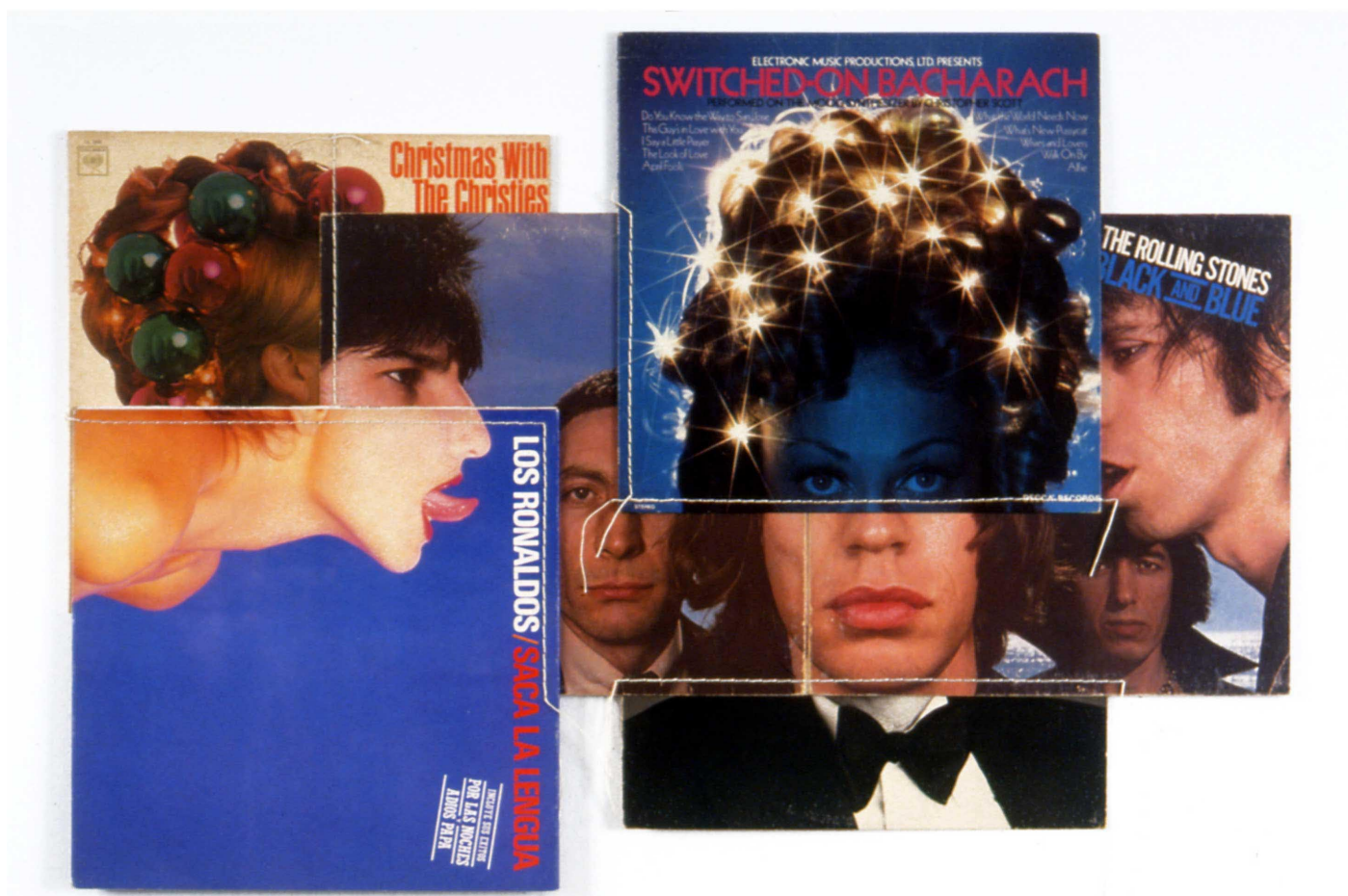
Série Body Mix , pochettes de vinyles, 55,9 x 79,4 cm, 1991, Courtesy Paula Cooper Gallery.