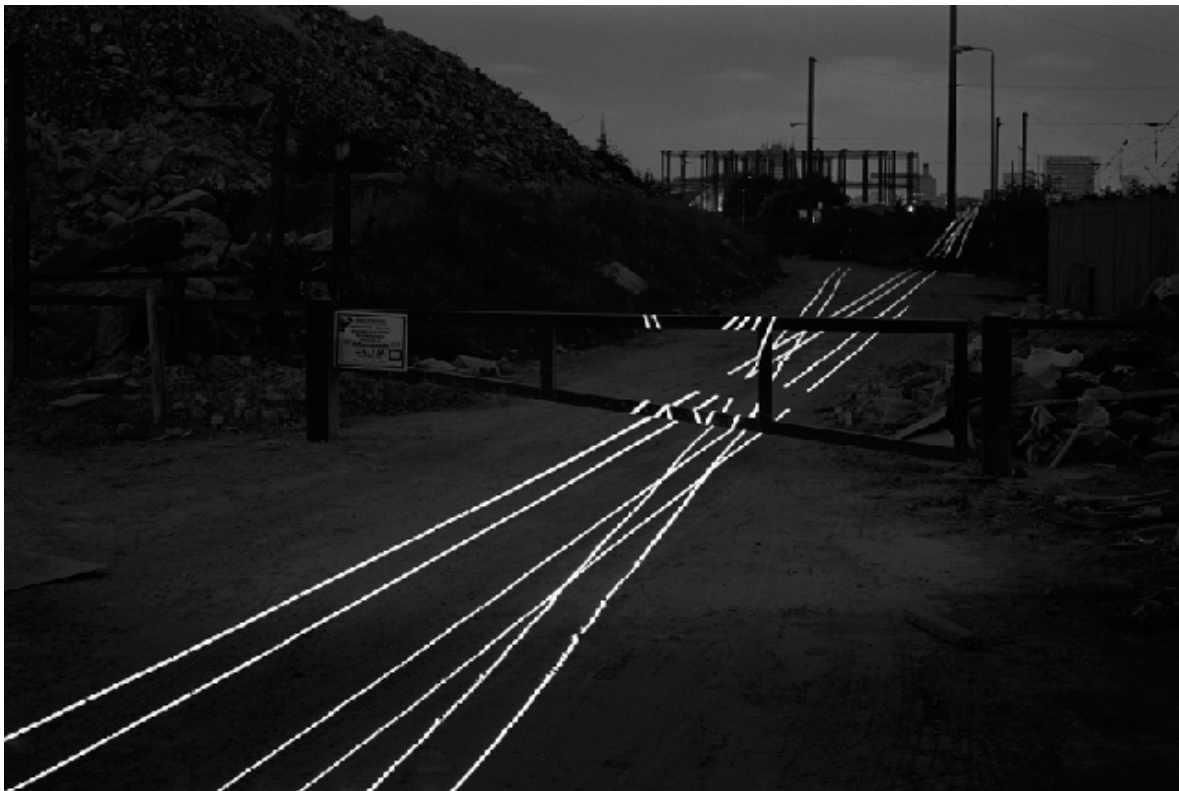
“Crossing King’s Cross” series, site-specific installation, London, photography, 1996.