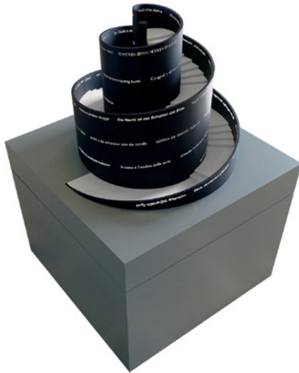
“Spiralturm” (Tour en spirale), “La nuit est l’ombre de la terre”, en 66 langues, 2003/2011, verre acrylique, laqué noir, illuminé de l’intérieur, avec escalier, socle laqué, 103 x 110 x 110 cm.