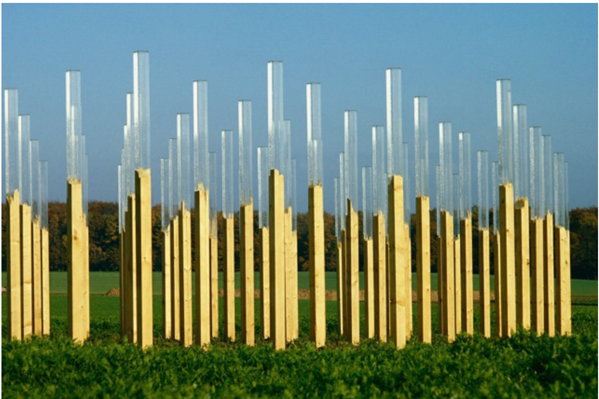
“Great Square”, Oberfeld, 1980, 81 pièces, 315x11x11cm chacune.