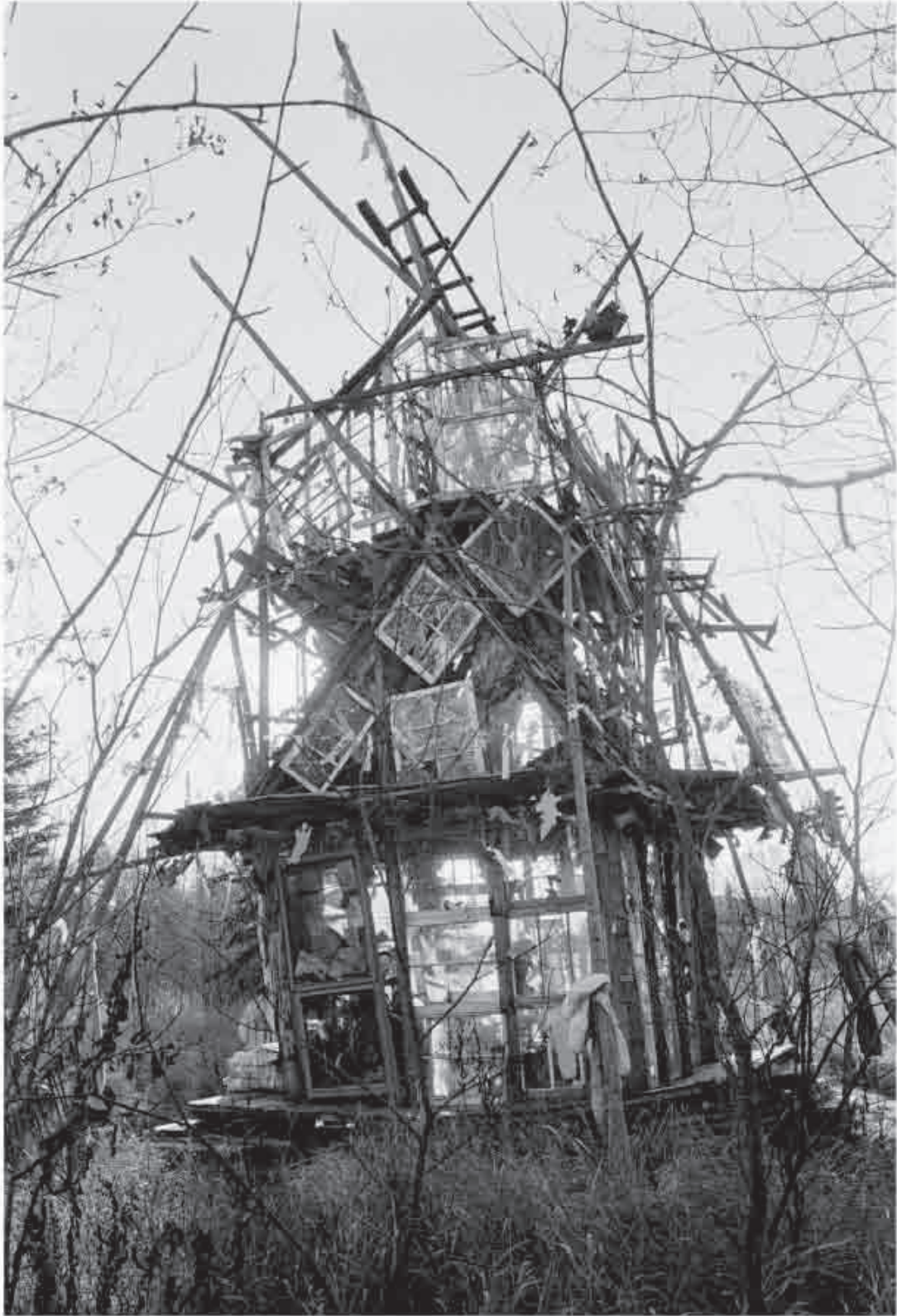
Richard Greaves, "Anarchitecture" (Canada), photo Mario del Curto.