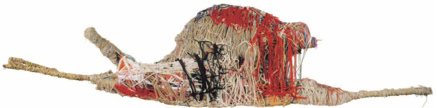
Judith Scott, laine et éléments divers assemblés, 60 x 250 x 40 cm, Collection ABCD.