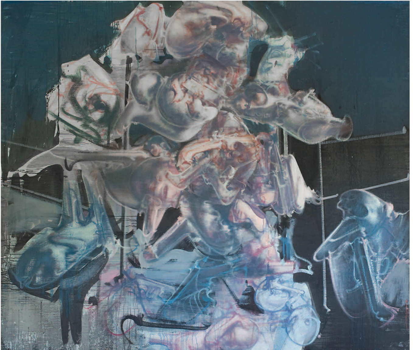
Dado, "Autoportrait à Nuremberg", 1997, huile sur toile 230 x 270 cm, Galerie Alain Margaron.