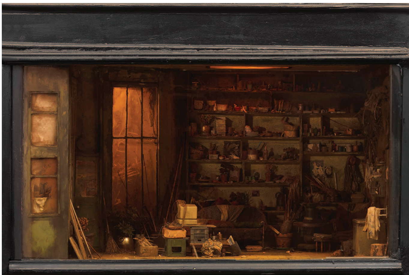
Ronan-Jim Sevellec, "La Mémoire qui meurt", 60 x 84 x 50 cm, Fonds de l'Abbaye d'Auberive.