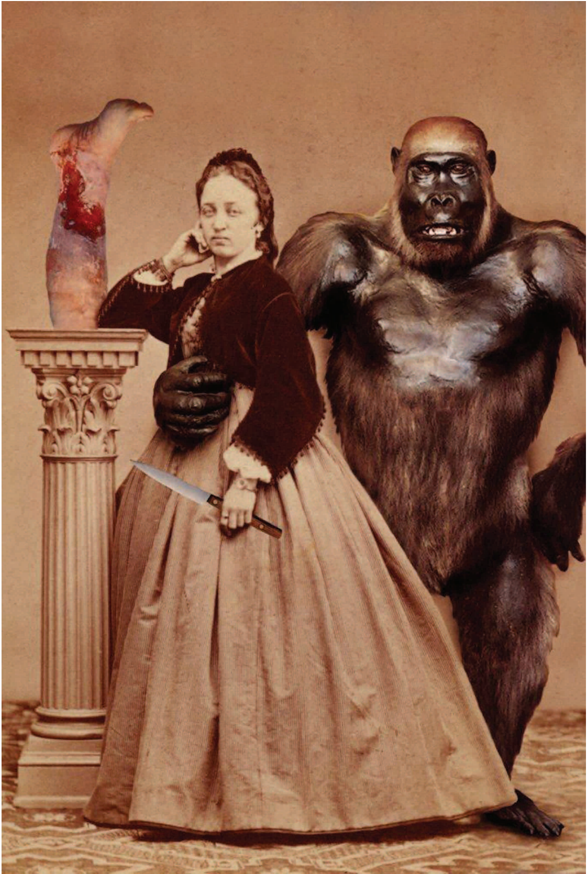
Anémone de Blicquy, "Portrait de Famille", photographies, 2002/2003.